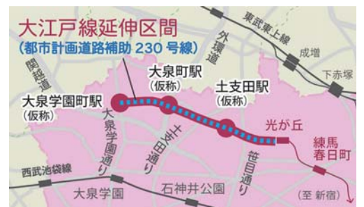
大江戸線延伸予定図(練馬区資料より作成)