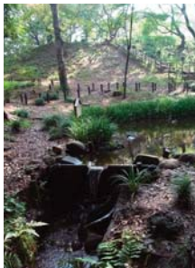
L51 清水山憩いの森の落葉

白子川流域にある斜面林。斜面に湧き出た水が、林の中を流れて白子川に注ぎこんでいます。カタクリが自生し、3月に見ごろをむかえます。