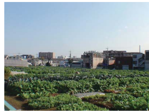
L112 広々と見渡せる土支田体験農園 田柄用水跡近くにある農地です。

土支田・大泉町では、屋敷森や農地など郷土が感じられる風景が、今でも多く見られます。明治4年に灌漑（かんがい）を目的に開さくした田柄用水は、現在は暗渠（あんきょ・ふたがしてある歩行路）になっていて、上を歩くことができます。