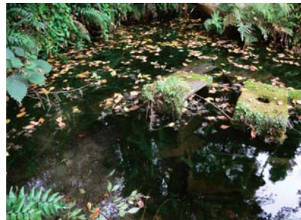
L50 稲荷山憩いの森入口の美しい湧水池

稲荷山と呼ばれた山のふもとに湧水の池があり、水量が豊富で「東京名湧水57選」にも選ばれています。かつては、地域の水田灌漑の補助水としても利用されたそうです。