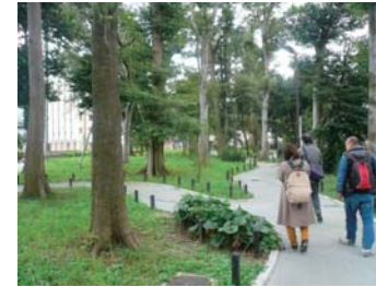
土支田の森公園 かつて屋敷森だったところが、今は公園になっています。