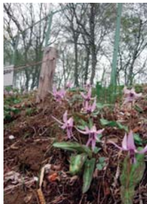
G167 清水山憩いの森のカタクリ