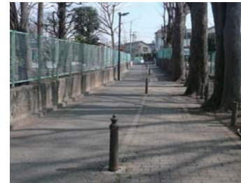
田柄用水跡（豊溪小学校南側）