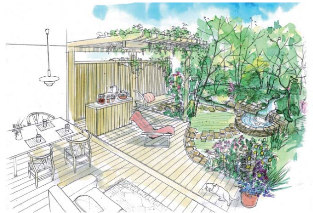
【イラスト】正木覚氏「ここちよい庭づくりの5つのポイント」より